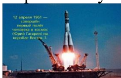
12 апреля 1961 — Советский первый полёт человека в космос (Юрий Гагарин на корабле Восток-1)

Корабль- спутник стартовал с космодрома "Байконур", позывным был "Кедр".