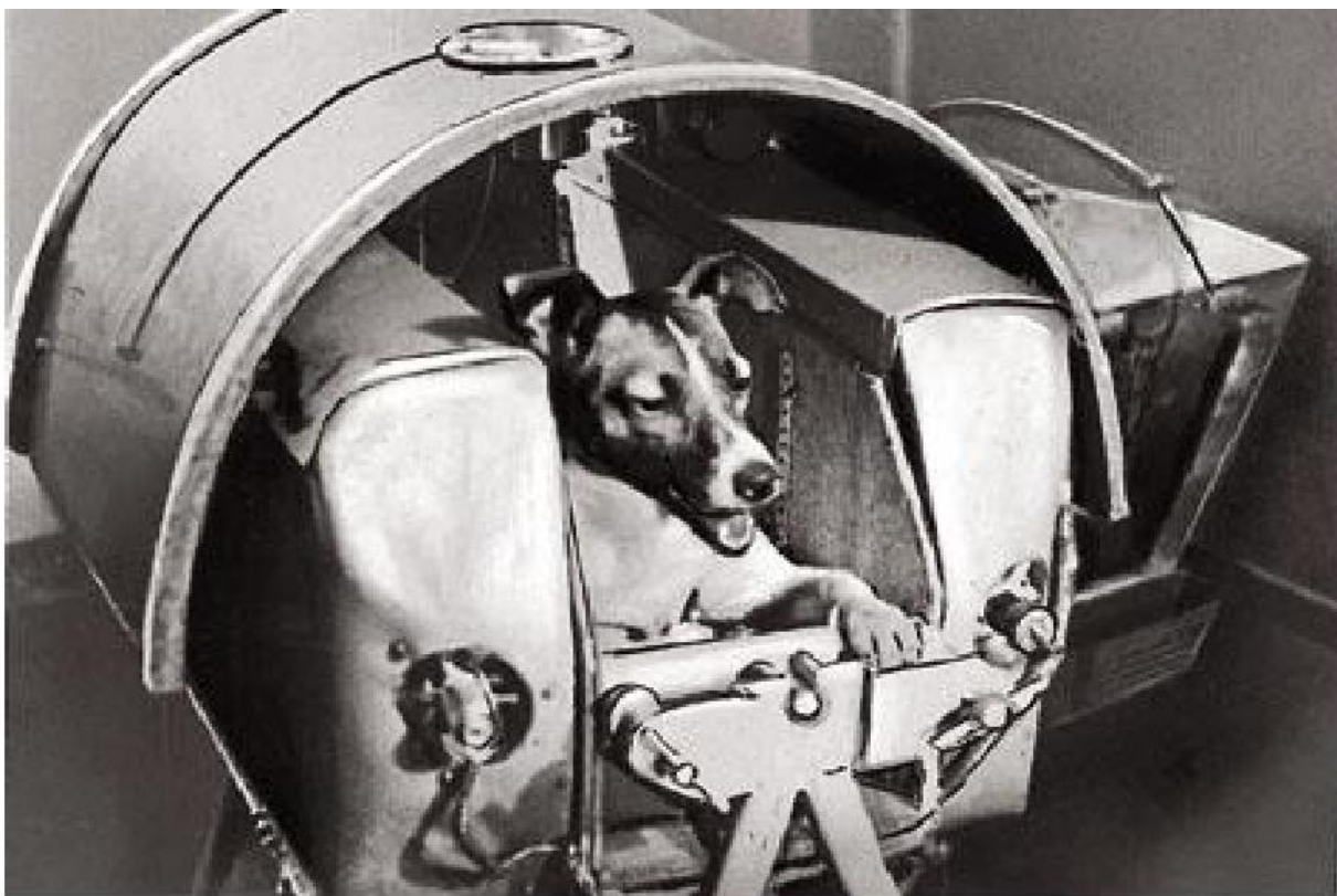
Собака Лайка в контейнере второго советского искусственного спутника Земли